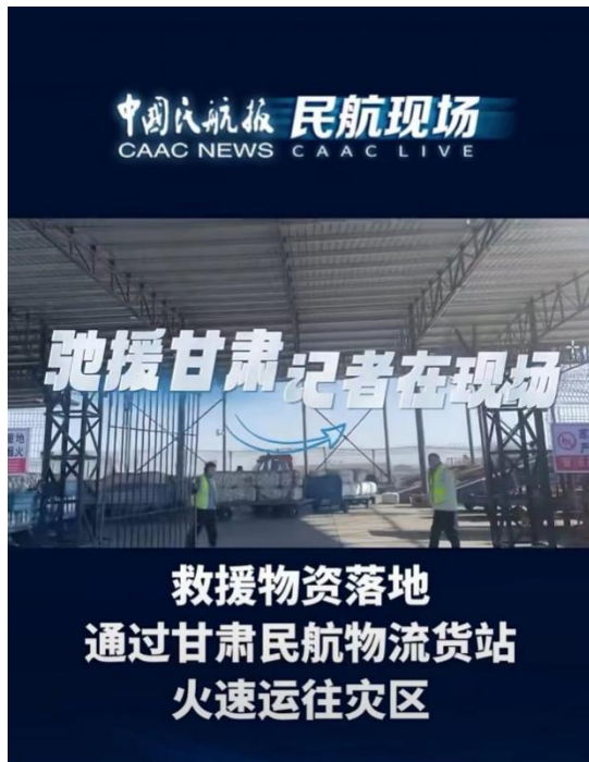
相关报道版面和视频页面