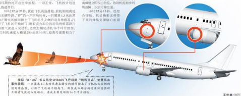
模拟“鸟击”长安航空 9H8409 飞行机组“教科书式”处置鸟击事件

弘扬模范先进，传播正能量，整版刊登《全国和民航五一劳动奖、工人先锋号先进事迹》《中国工会第十八次全国代表大会民航代表团劳模代表风采展示》。