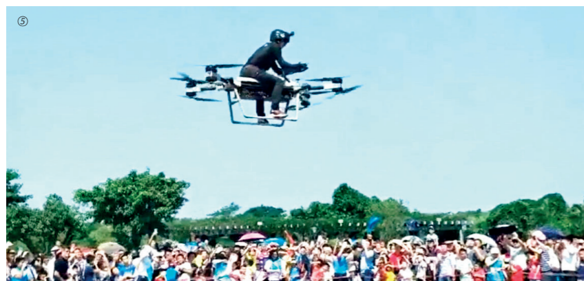
① 2013年，赵德力创立汇天科技有限公司，投入到他梦想的飞行摩托的研发当中。 ② 2020年之前，赵德力以草根发明家、飞行极客的身份，到各地电视台参加综艺节目。 ③ 广东卫视《今日一线》栏目记者采访赵德力。 ④ 2020年夏天，赵德力驾驶敞篷双人飞行摩托，已经身价过亿的何小鹏就坐在赵德力的身后，两人飞行在夕阳西下的低空之中…… ⑤ 赵德力骑着自研的飞行摩托进行飞行表演。