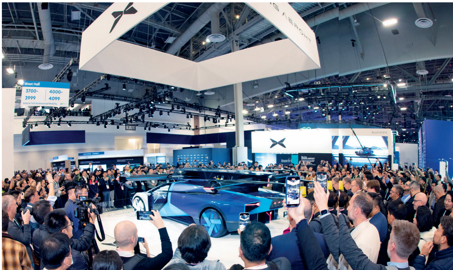
小鹏汇天陆空一体式飞行汽车今年1月参加了美国消费电子展(CES)，被现场观众围观热议，引发全球关注。