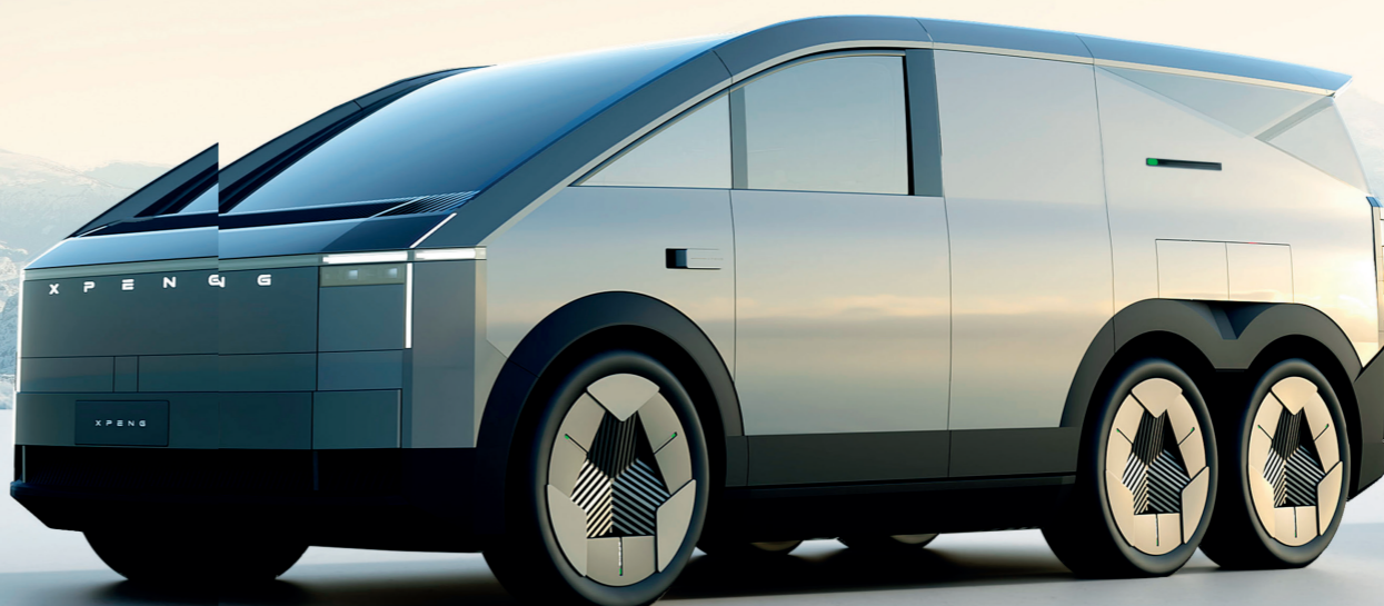
小鹏汇天“陆地航母”分体式飞行汽车